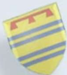
Atelier Municipal n°1