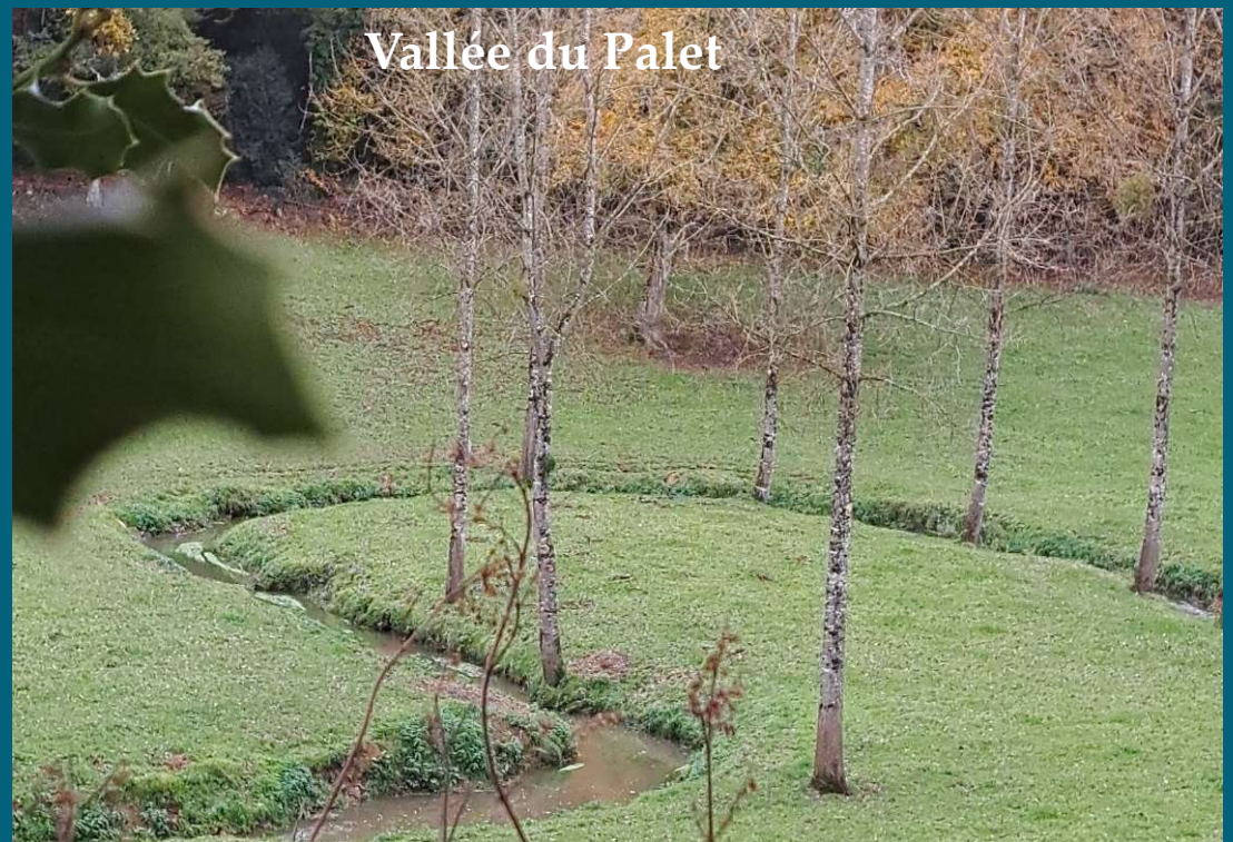
Vallée du Palet