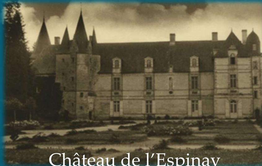
Château de l'Espinay