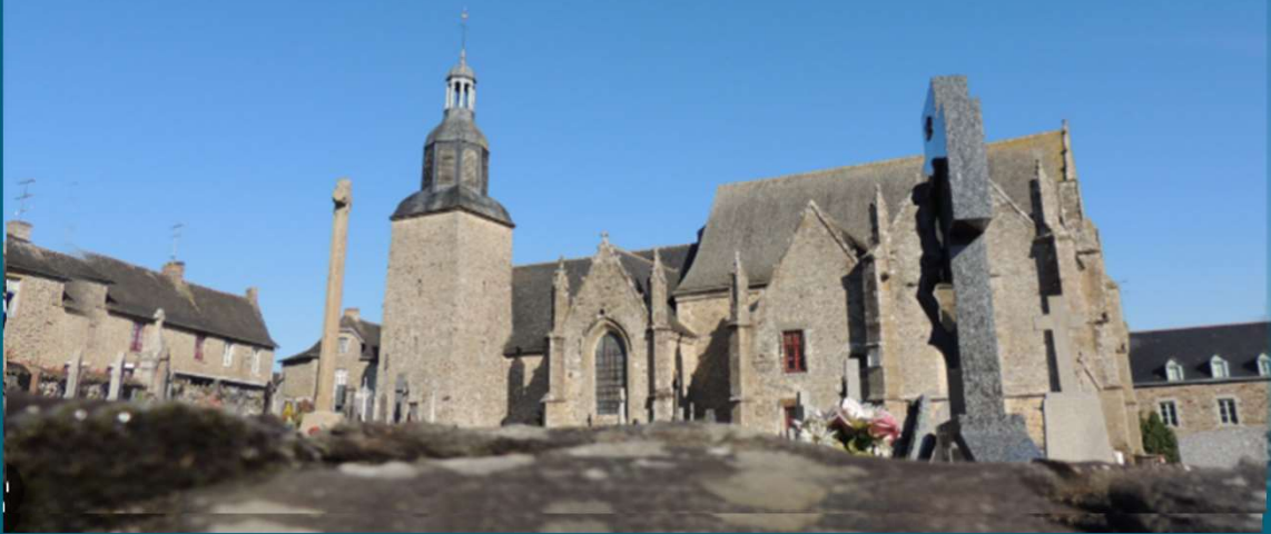
Collégiale Ste Marie Madeleine